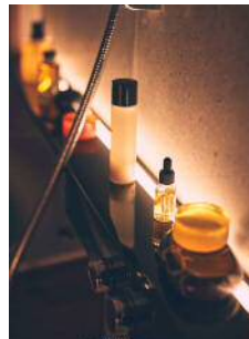
ライトアップロング カウンター