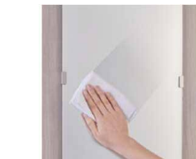
ミラー (ささっとキレイ仕様)