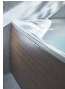
エプロン ナチュラルウッド