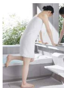
おきラクスマート手すり