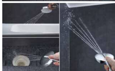
「ビームシャワー」お掃除モード