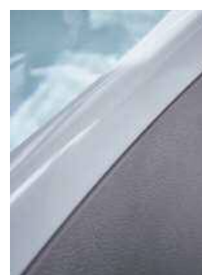
エプロン グレイジュレー