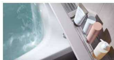
おきラクスマート手すり