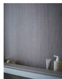
壁 チェスナットグレイジュ柄