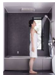
スゴピカシェルフ水栓 (H950)