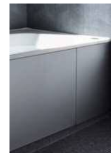
エプロン メタリックシルバー