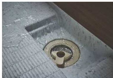
3Dプロテクトクリーンフロア (スミピカ/ささっとキレイ仕様)

「3Dプロテクトクリーンフロア」は、フッ素・有機ガラス系素材配合の汚れが取れやすい特殊なシートで、床表面から排水口接続部までを継ぎ目なく覆っているため、お手入れがとてもラクになります。また、清掃に適したパワフルな水流の「ビームシャワー」、キレイが長持ちする「スゴピカ素材」の浴槽や水栓、汚れが落ちやすいささっとキレイ仕様のエプロンやミラー、カビ対策にもなる「カビシャット暖房換気乾燥機」など、お掃除をラクにするパナソニックのテクノロジーを集結させました。