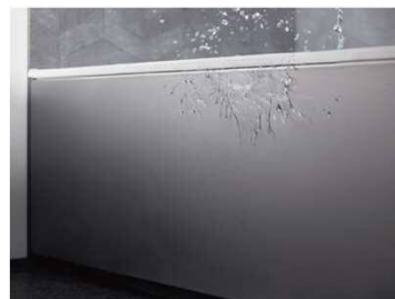
エプロン (ささっとキレイ仕様)