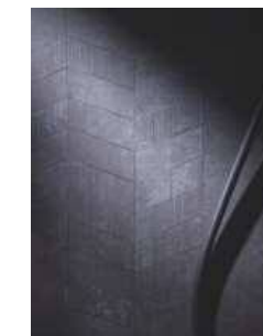
壁 ヘリンボーンブラック柄