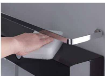
スゴピカシェルフ水栓