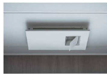
カビシャット暖房換気乾燥機