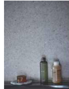
壁 シャクダニ石柄