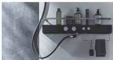
スゴピカシェルフ水栓