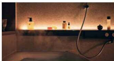
ライトアップロングカウンター